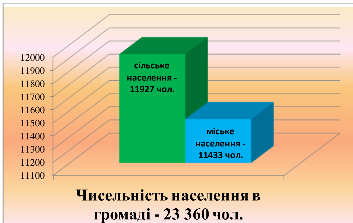
Малюнок 1. Чисельність населення Деражнянської міської територіальної громади

Деражнянська громада розташована в центральній – східній частині Хмельницької області. Територія громади згідно з адміністративно-територіальним устроєм України входить до складу Хмельницького району Хмельницької області. Центром територіальної громади є місто Деражня, Хмельницького району, Хмельницької області. Площа територіальної громади – 624,79 км 2 . Чисельність населення Деражнянської громади станом на 1 січня 2022 року становить 23360 чоловік, з них: міське населення – 11433, сільське населення – 11927 осіб.